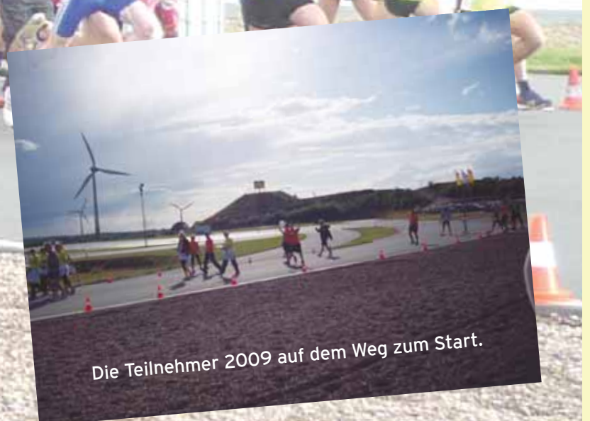
Die Teilnehmer 2009 auf dem Weg zum Start.

Bei Anmeldungen bis zum 15.03.2010 gibt es ein Team-Trikot-Shirt.